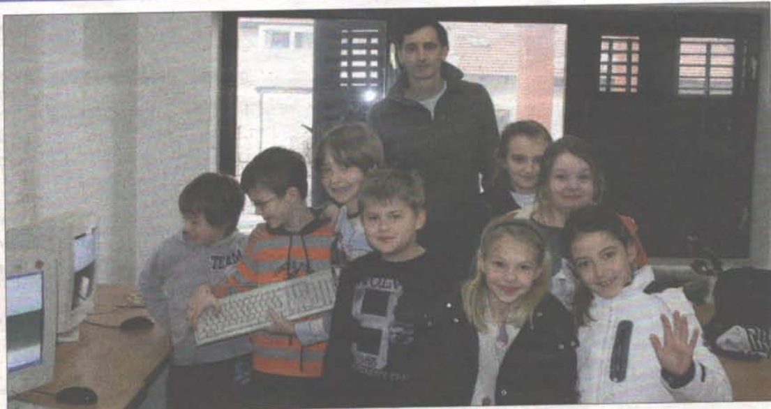
Zagreb je najkvalitetnija i najbrojnije zastupljena hrvatska županija na državnim natjecanjima iz informatike